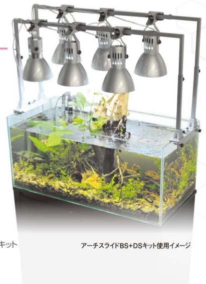
アーチスライドBS+DSキット使用イメージ